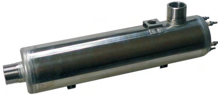
แนวตั้ง (A B C)